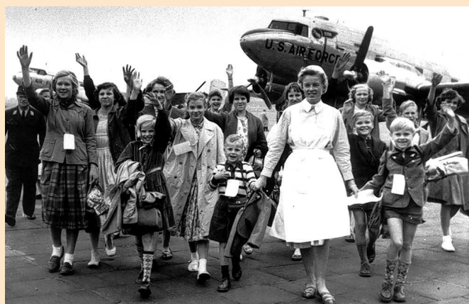
1956: Mit den Einnahmen aus den allerersten Losverkäufen dürfen Berliner Kinder aus der zerstörten Stadt in die Ferien fliegen.