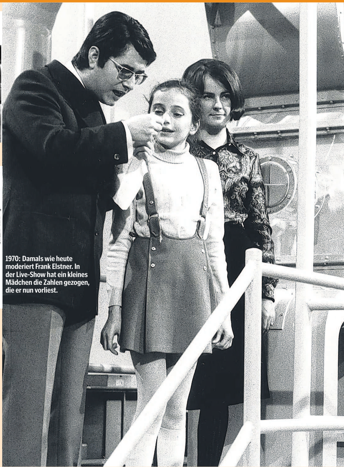
1970: Damals wie heute moderiert Frank Elstner. In der Live-Show hat ein kleines Mädchen die Zahlen gezogen, die er nun verliert.