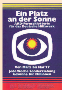
Mit diesen Werbemotiven warb die ARD-Fernsehlotterie für ihre Lose. Das Plakat links ist von 1958, die anderen von 1961 und 1977 (r.).

bung. „Wir dürften nicht mehr offensiv werben und Begehrlichkeiten auf einen Gewinn wecken. Der karitative Aspekt muss im Vordergrund stehen“,